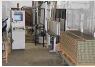
Centre d'usinage vertical