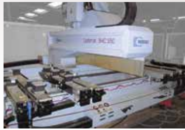
Centre d'usinage 4 axes